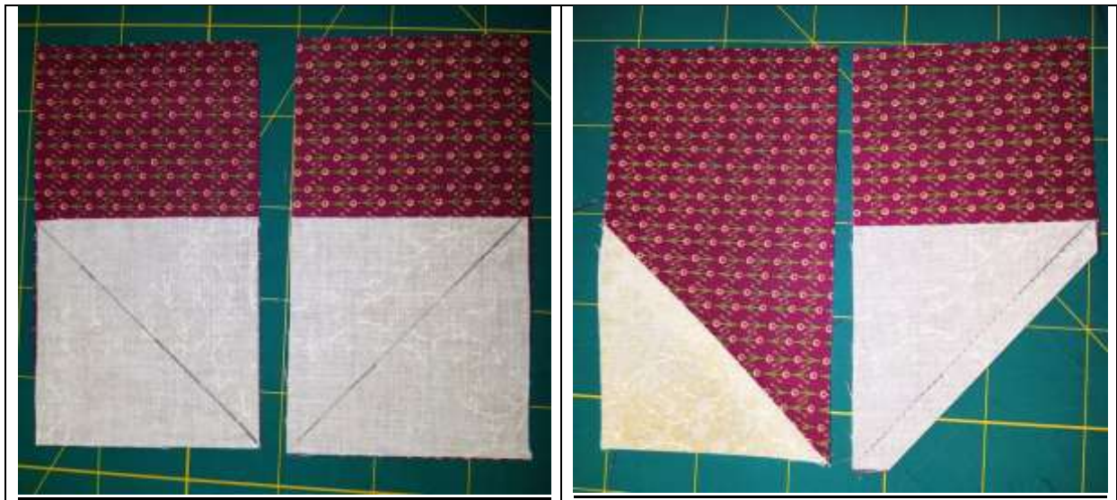
Foto 2 und Foto 3

Macht es mit den kleineren Quadraten ebenso, legt sie wie auf Foto 4, näht genau auf der Linie und schneidet zurück, bügeln.